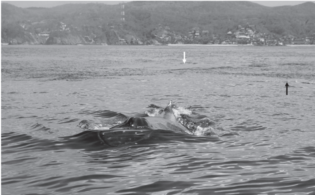
Fig. 2. Ballena jorobada emergiendo horizontalmente y desplazándose en esta posición en línea recta para finalizar la maniobra de alimentación. La flecha en blanco indica la huella de buceo o inicio de la maniobra y la negra el remanente de la línea de anchovetas (Cupleiformes).

mostrando su aleta caudal, lo que permitió tomar fotografías de la aleta, la cual fue ingresada al catálogo FIBCCO, con la clave de identificación 5OAX012.12FV1.