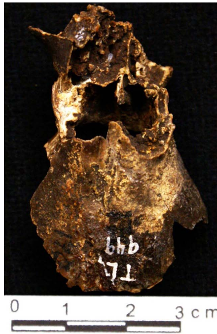
Figura 3. Fotografías de los fragmentos de un cráneo DP-949 de un ejemplar de la nutria neotropical Lontra longicaudis , procedente del sitio arqueológico-paleontológico de Tlapacoya, Estado de México. Las fotografías corresponden a: A) Región basioccipital; B) Vista ventral/oclusal de una porción del maxilar con el diente carnasial izquierdo; C) Vista dorsal de la región frontal.

El uso del nombre que los autores arriba señalados hacen de Lutra canadensis corresponde a la propuesta de ese entonces (ver, por ejemplo, Hall y Kelson 1959); no fue sino hasta que Van Zyll de Jong (1972) revisó las nutrias y propuso que las especies americanas que pertenecían a Lutra , en realidad deberían estar asignadas al género Lontra Gray, 1843. Además, existen dos especies en Norteamérica, L. canadensis se distribuye en gran parte de Norteamérica, al norte de México de donde fue extirpada en el pasado (Álvarez-Castañeda 2000), mientras L. longicaudis ocupa gran parte del territorio mexicano, desde