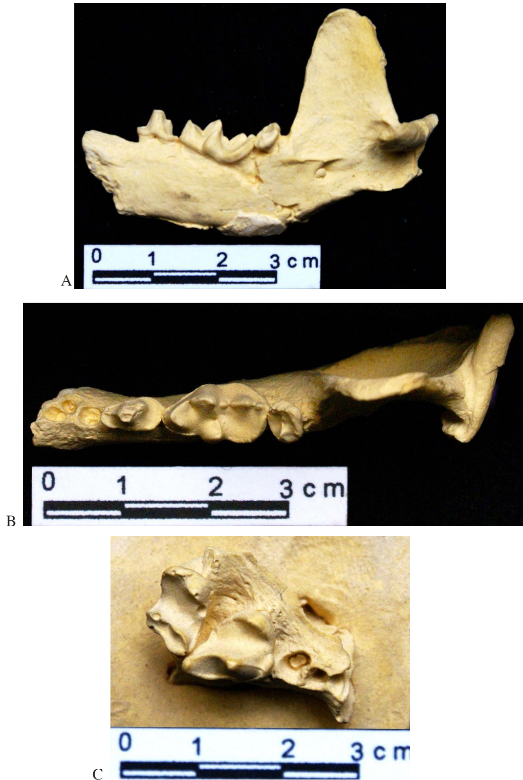
Figura 2. Fotografías de las réplicas (DP 1224) del fragmento de mandíbula izquierda (A, B) y de la maxila izquierda (C) de un ejemplar de la nutria neotropical Lontra longicaudis , procedente de los yacimientos del Lago de Chapala, Jalisco. Las fotografías corresponden a: A) Vista lingual; B) Vista oclusal; C) Acercamiento del diente carnasial.

de Paleontología de Guadalajara, aunque los ejemplares no se localizaron en esta ocasión; afortunadamente, existen dos réplicas de una maxila y un dentario, que están depositadas en la Colección Paleontológica del Laboratorio de Arqueozoología "M. en C. Ticul Álvarez Solórzano" como un lote bajo el mismo número de catálogo (DP 1224), Subdirección de Laboratorios y Apoyo Académico, INAH (Fig. 2).