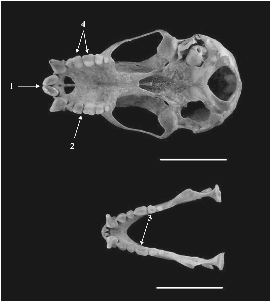
Figura 2. Vista ventral del cráneo (arriba) y mandíbula (abajo) del espécimen MUA 10641, Sturnira koopmanhilli mostrando sus características distintivas. Escala: 10 mm. Caracteres: 1. Incisivos centrales superiores protruidos, bilobulados y con lóbulos centrales convergiendo hacia las puntas; 2. Espacios en molares superiores; 3. Protolofido en el primer molar inferior (ver Pacheco y Patterson 1991); 4. Diferencia de tamaño entre primer y segundo molar superior.

una distribución exclusivamente asociada a la provincia biogeográfica del Chocó y Magdalena ( sensu Hernández-Camacho et al. 1992), particularmente hacia el piedemonte Andino. Patrones de distribución geográfica similares se pueden observar tanto en otros quirópteros ( Vampyressa nymphaea , Dermanura phaeotis ), así como en especies de otros grupos taxonómicos como Amazilia amabilis (Aves: Trochilidae; Hilty y Brown 1986) y Rhinobothryum bovallii (Serpentes: Dipsadidae; Rojas-Morales 2012), entre otros.