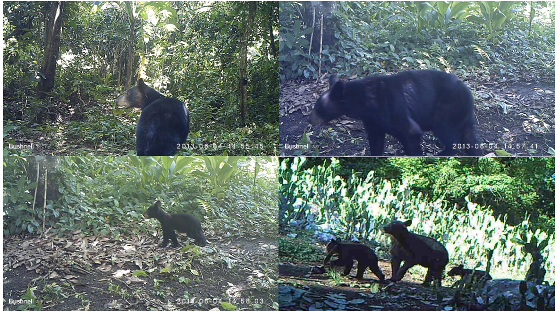
Figura 2. Imágenes de oso negro ( Ursus americanus ) capturadas con foto-trampeo en bosque tropical subperennifolio, en la Reserva de la Biosfera El Cielo, Tamaulipas, México.