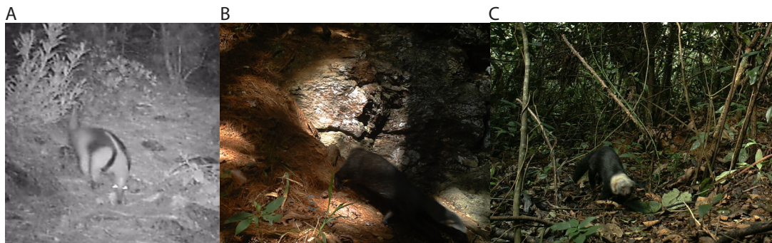
Figura 2. Fotografías de: A) Tamandua mexicana (IBUNAM-CFB-17410), tomada en bosque de pino-encino en la localidad de Concepción Pápalo, Oaxaca. B) Eira barbara (IBUNAM-CFB-17171), tomada en bosque mesófilo de montaña en la localidad de Santa María Pápalo, Oaxaca. C) Galictis vittata (IBUNAM-CFB-174), tomada en bosque mesófilo de montaña en la localidad de Santa María Pápalo, Oaxaca.

Con base en lo señalado, es necesario realizar programas de monitoreo a largo plazo, que aseguren el registro de especies con conductas crípticas y que ayuden a generar información sobre estas especies: no sólo sobre su distribución, sino también sobre su ecología, ya que probablemente