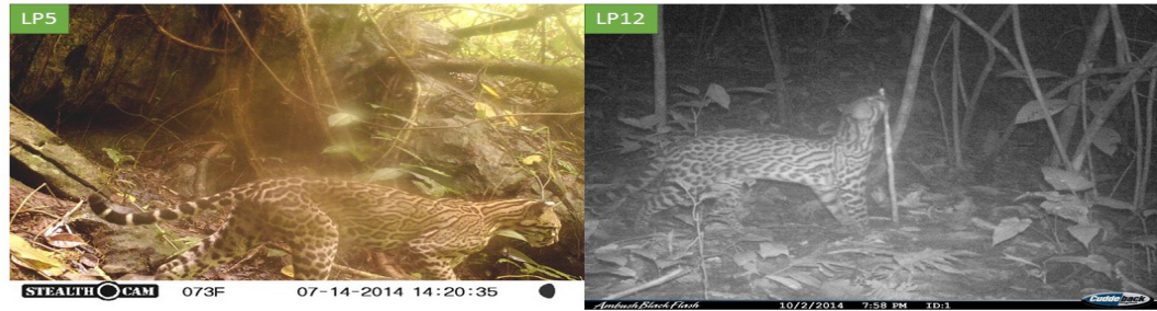
Figura 2. Ocelotes ( Leopardus pardalis ) diferenciados por su patrón de manchas en la Sierra Negra de Puebla y la Sierra Mazateca de Oaxaca, México.