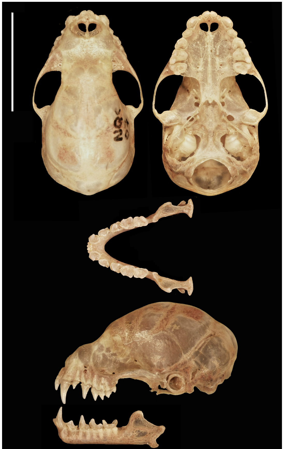
Figura 1. Vista del cráneo y mandíbula de Vampyriscus brocki (MUSA 15716) (Escala: 10 mm).