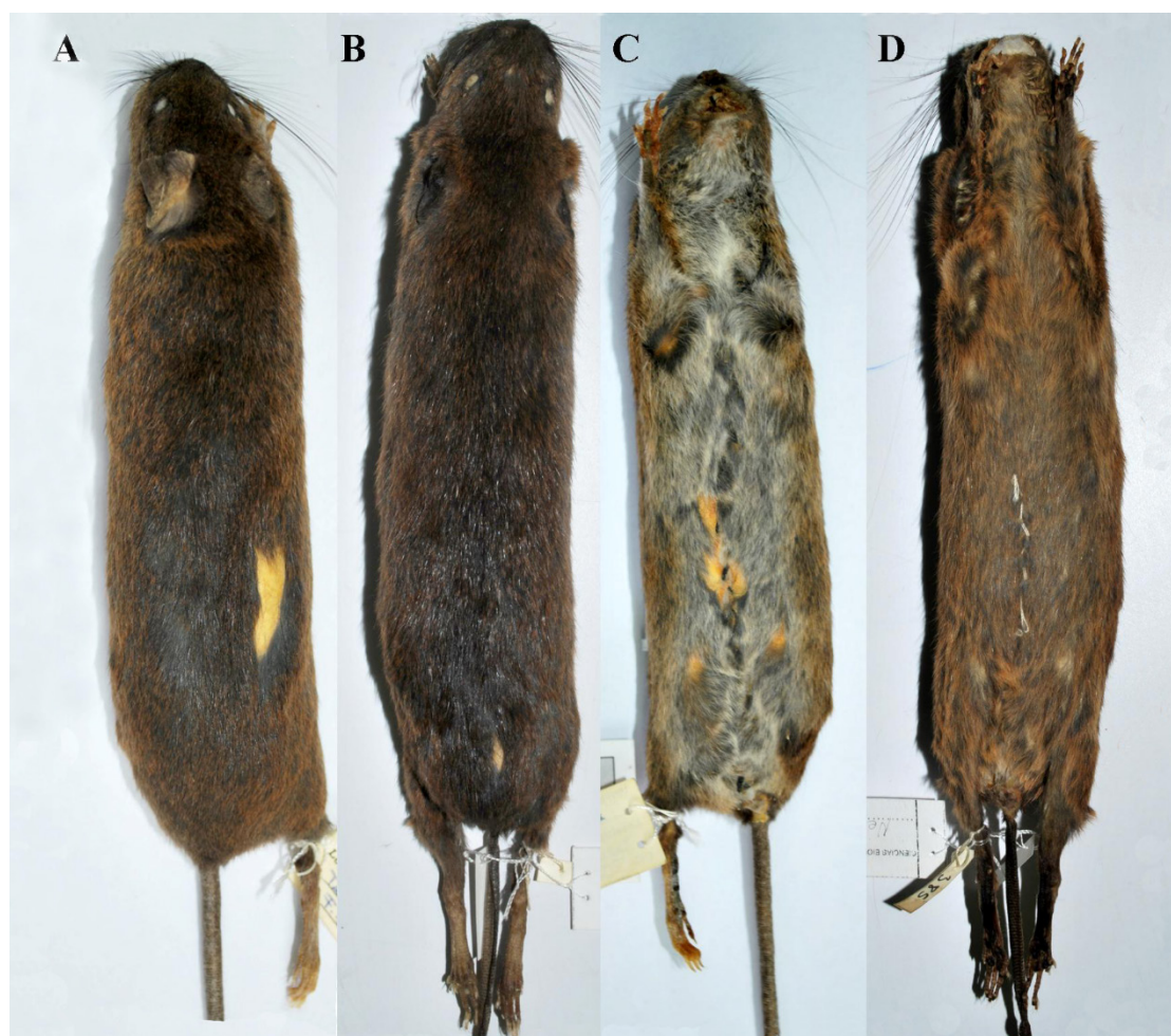
Figura 1. Vista dorsal (A) y ventral (C) de una hembra adulta de Nephelomys nimbosus (DMMECN 1083); longitud cabeza-cuerpo = 142 mm. Vista dorsal (B) y ventral (D) de una hembra adulta de N. auriventer (MEPN 12214); longitud cabeza-cuerpo = 151 mm.