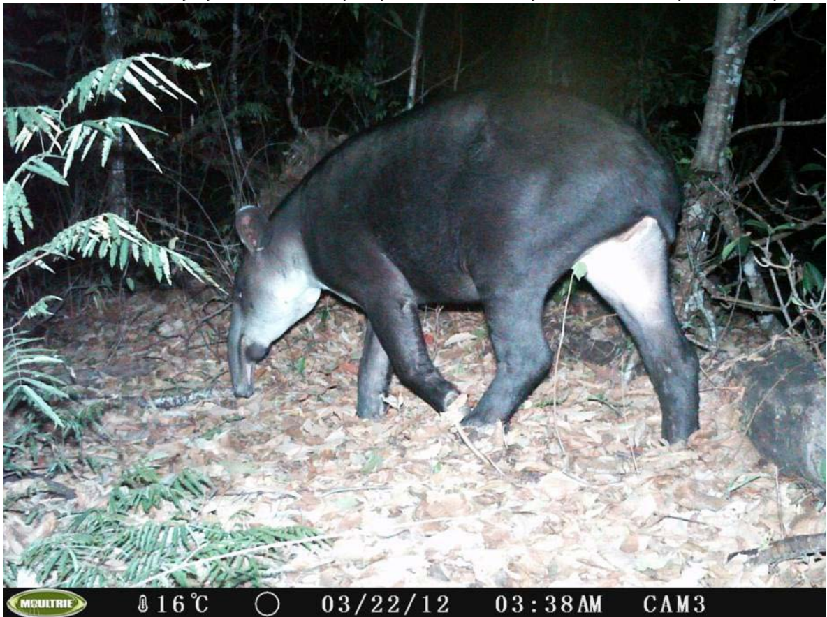
Figura 6. Hembra adulta de tapir ( Tapirus bairdii ) fotografiada durante el proyecto con cámara-trampa en la Reserva Balam-kin, Campeche.

Abundancia. Los índices de abundancia estimados a partir de muestreos en transectos lineales variaron entre 0.26 - 4.52 rastros de tapires, y 0.15 - 0.63 rastros de pecaríes de labios blancos por 10 km recorridos (Figuras 7 y 8, Tabla 3). En el caso del tapir, los valores de abundancia obtenidos en este estudio se encuentran dentro del rango de abundancias estimadas en estudios previos realizados en México (0.05 a 8.1 rastros por 10 km; Lira et al. 2004; Naranjo 2009; Naranjo y Bodmer 2002; Naranjo y Cruz 1998; Reyna y Tanner 2007; Tejeda et al. 2009) y en otros países