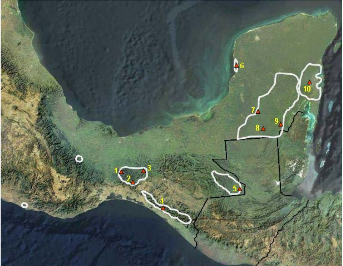
Figura 3. Ubicación de los sitios de estudio donde se evaluaron poblaciones de tapir y pecarí de labios blancos: 1) Uxpanapa, 2) Los Chimalapas, 3) Selva El Ocote, 4) La Fraylescana, 5) Marqués de Comillas, 6) Los Petenes, 7) Balam-kin y Balamkú, 8) Calakmul, 9) Ejidos forestales de Quintana Roo, 10) Sian Ka'an. Las áreas delineadas indican la distribución aproximada del tapir.

son las selvas bajas caducifolias, selvas medianas subperennifolias, bosques de pino, bosques de encino y bosques mesófilos de montaña. En el área existen registros recientes de tapir, pero no de pecarí de labios blancos. Parte del área protegida está ocupada por pastizales inducidos, cafetales y cultivos de temporal. En el área existen procesos de deforestación por extracción de madera, expansión de la ganadería y la agricultura, cacería furtiva, erosión e incendios forestales (Pérez-Farrera et al. 2006). Los muestreos se efectuaron en la Finca Arroyo Negro, municipio de La Concordia, Chiapas.