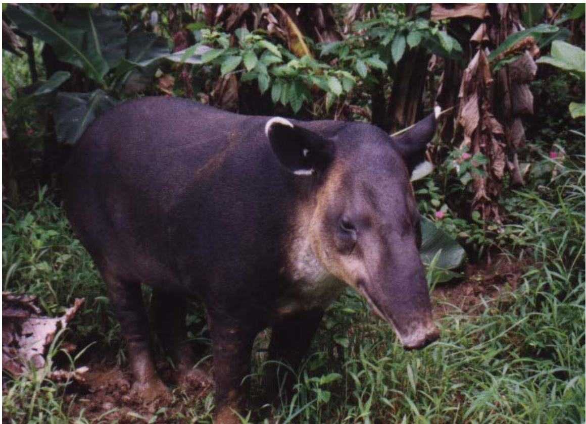
Figura 1. Tapir centroamericano ( Tapirus bairdii ). Selva Lacandona, Chiapas.

La investigación realizada sobre el tapir en el país se ha limitado a unas pocas poblaciones. La abundancia poblacional, las preferencias de hábitat, el rango de acción individual y los hábitos de alimentación de tapires han sido estudiados en algunas localidades de Chiapas Campeche y Oaxaca mediante conteos de individuos y rastros en transectos lineales (Lira y Naranjo 2005; Muench 2001; Naranjo y Cruz 1998; Naranjo y Bodmer 2002), observación de plantas ramoneadas y análisis de excrementos (Cruz 2001; Naranjo y Cruz 1998; O’Farril et al. 2006; Rivadeneyra 2007; Naranjo 2009), radiotelemetría (Lira 2006; Naranjo y Bodmer 2002) y foto-trampeo (Carbajal-Borges et al. 2014; Lira et al. 2014; Pérez y Matus 2010). Las estimaciones de densidad disponibles para México se ubican entre 0.01 y 0.5 tapires/km 2 (Carbajal-Borges et al. 2014; Naranjo 2009). Considerando estas densidades tan bajas, resulta evidente que solo unas pocas reservas en el país parecen ser suficientemente grandes para albergar poblaciones viables de tapires conformadas por varios cientos de individuos (Naranjo 2009). Los factores de amenaza más importantes para el tapir son indudablemente la pérdida de hábitat y la cacería sin control (March y Naranjo 2005; Naranjo 2014).