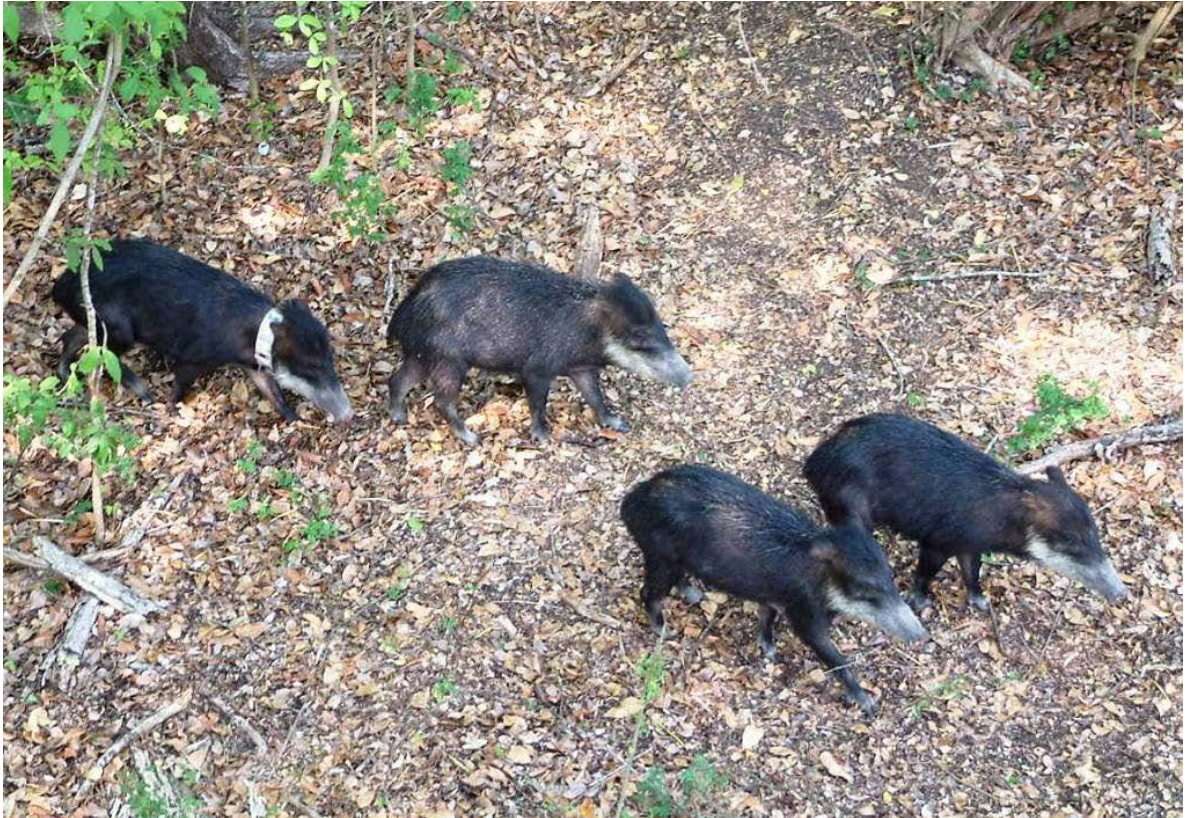
Figura 2. Pecaríes de labios blancos ( Tayassu pecari ). Reserva de la Biosfera Calakmul, Campeche.

El pecarí de labios blancos se distingue considerablemente de otros mamíferos neotropicales por las grandes manadas que llega a formar y que pueden sobrepasar los 100 individuos (Sowls 1997). El tamaño promedio de los grupos registrados en México es de 13 - 28 individuos (Naranjo 2002; Reyna 2002). Su densidad poblacional se ha estimado entre 1 y 15 individuos/km 2 , aunque con frecuencia estas cifras se encuentran por debajo de 5 ind/km 2 en sitios con cacería persistente (Bodmer et al. 1997; Naranjo et al. 2004a; Sowls 1997). Este mamífero requiere para sobrevivir de áreas forestales extensas (>10,000 ha) y sin actividad humana, preferentemente selvas altas y medianas húmedas, así como bosques bajos inundables (March 2005; Mayer y Wetzel 1987; Reyna 2007).