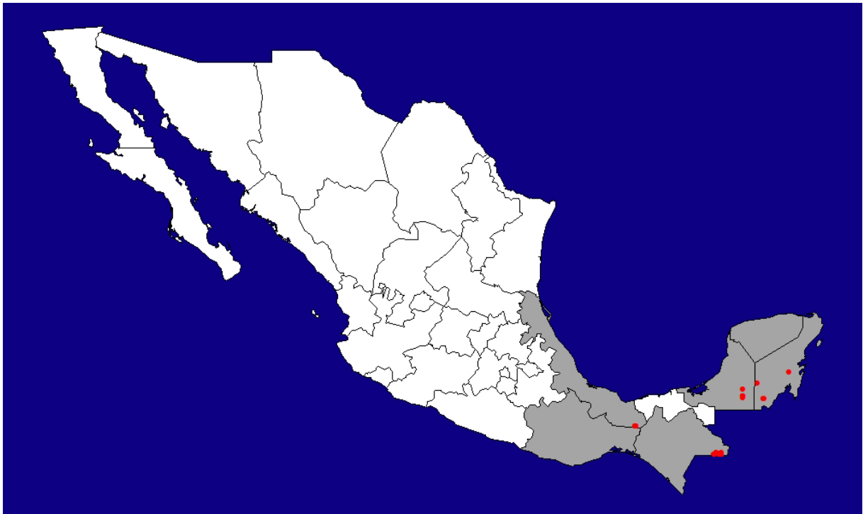
Figura 5. Distribución actual del pecarí de labios blancos ( Tayassu pecari ) en México con base exclusivamente en los registros obtenidos ( n = 26 ) en el trabajo de campo del presente proyecto. Mapa: Fredy Falconi Briones.

de labios blancos solamente persiste en siete de los 10 sitios de estudio (ausente de La Fraylescana, Selva El Ocote y Los Petenes) y en 12 de las 20 comunidades visitadas. Prácticamente todos (100 %) los pobladores consultados conocen a las dos especies ya sea por observación directa de animales vivos o cazados, o por referencia directa de sus padres y abuelos. La gran mayoría (81 %; 90/111) de los entrevistados aseguró que el tapir está presente en sus comunidades, mientras que el 15.3 % (17/111) afirmó que esta especie ya no está presente, y el restante 3.7 % (4/111) dijo no estar seguro. En el caso del pecarí de labios blancos, solamente el 34.2 % (38/111) de los entrevistados dijo que la especie aún está presente en su comunidad, mientras que la mayoría de ellos (59.5 %; 66/111) afirmó que ya no está presente, y el restante 6.3 % (7/111) no sabía. La percepción de los habitantes de los sitios de estudio evaluada a través de las entrevistas realizadas sugiere que el pecarí de labios blancos tiene actualmente una distribución notablemente más restringida que la del tapir en el país, lo cual coincide plenamente con los registros fotográficos y avistamientos de ejemplares y sus rastros logrados en este estudio.