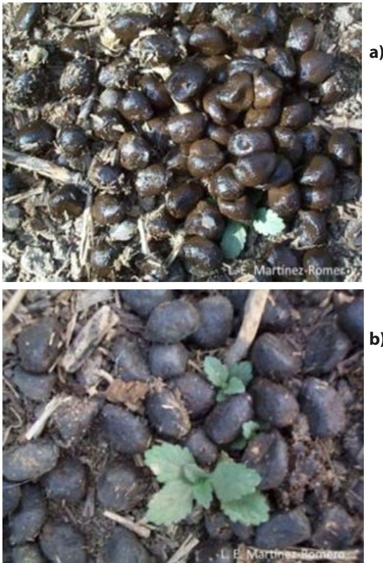
Figura 1. Imágenes mostrando el cambio en coloración y aspecto experimentado por las excretas de venado cola blanca en el momento en que se defecan (a) y varios después (b).