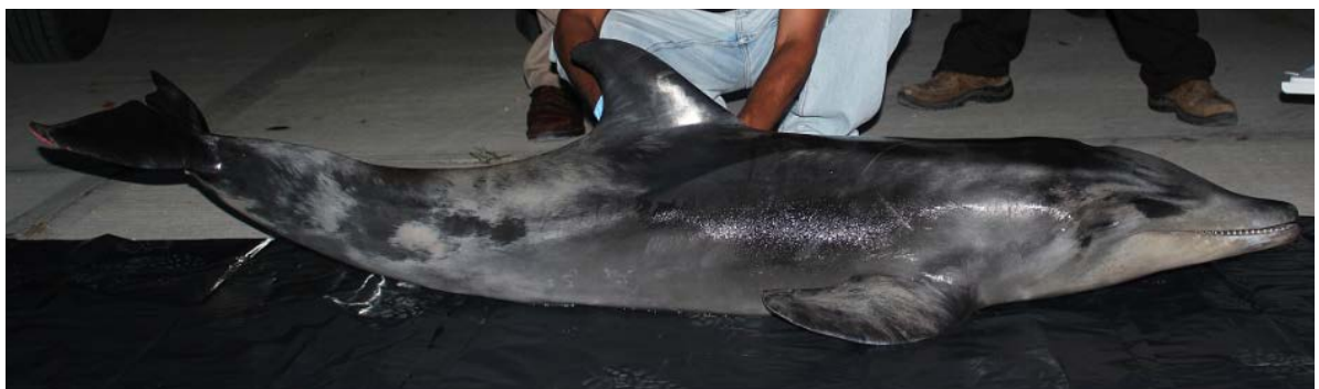
Figura 2. Ejemplar varado de Steno bredanensis con patrón de coloración jaspeada en gris oscuro y claro, durante la revisión del cuerpo en la Universidad del Mar campus Puerto Escondido.

Cabe mencionar que el conocimiento sobre la biodiversidad del orden Cetartiodactyla en el estado de Oaxaca, es incipiente y reside principalmente en estudios esporádicos y oportunistas de varamientos. Con estos aportes, se ha confirmado la presencia de especies de la familia Delphinidae; Stenella coeruleoalba (Wilson et al. 1987), Pseudorca crassidens (Meraz y Becerril-Morales 2004), S. attenuata , S. longirostris , T. truncatus , Orcinus orca , Feresa attenuata