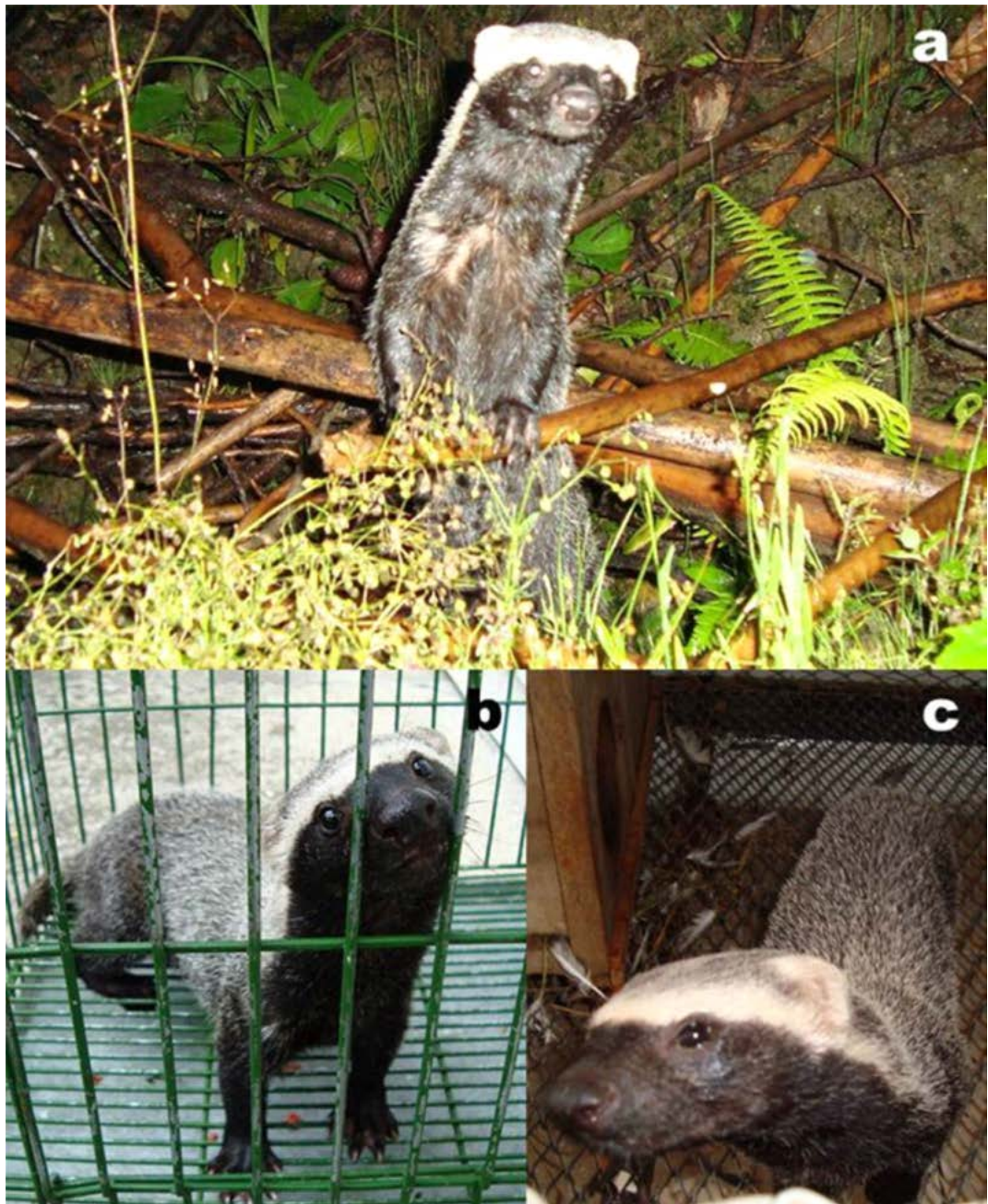
Figura 2. Registros fotográficos del Hurón Mayor Galictis vittata en el departamento de Caldas-Colombia. (a), Individuo avistado en el 2009 en el Recinto del Pensamiento, Municipio de Manizales. (b) Individuo ingresado al Centro de Atención, Valoración y Rehabilitación de Fauna Silvestre (CAV) en el 2009, proveniente de la zona urbana del municipio de Marquetalia. (c) Individuo ingresado al Centro de Atención, Valoración y Rehabilitación de Fauna Silvestre (CAV) en el 2009, proveniente del Río Guarinó, municipio Marquetalia.