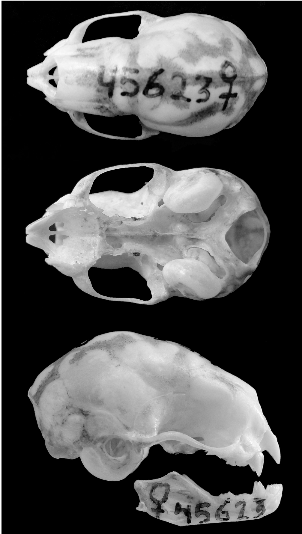
Figura 2. Vista dorsal, ventral y lateral del cráneo (longitud total de 21.96 mm) y lateral de la mandíbula de una hembra adulta de Diphylla ecaudata (C N M A - 4 5 6 2 3), procedente de 2.5 km NE Mesa Prieta, Guanajuato, México.