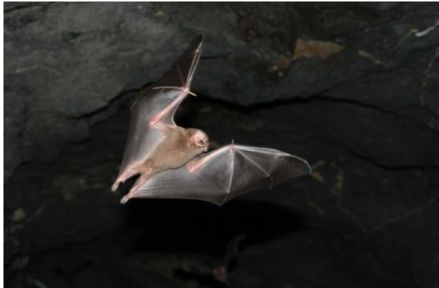
Figura 3. Diphylla ecaudata en vuelo en la mina abandonada "Majada", Guanajuato, México.