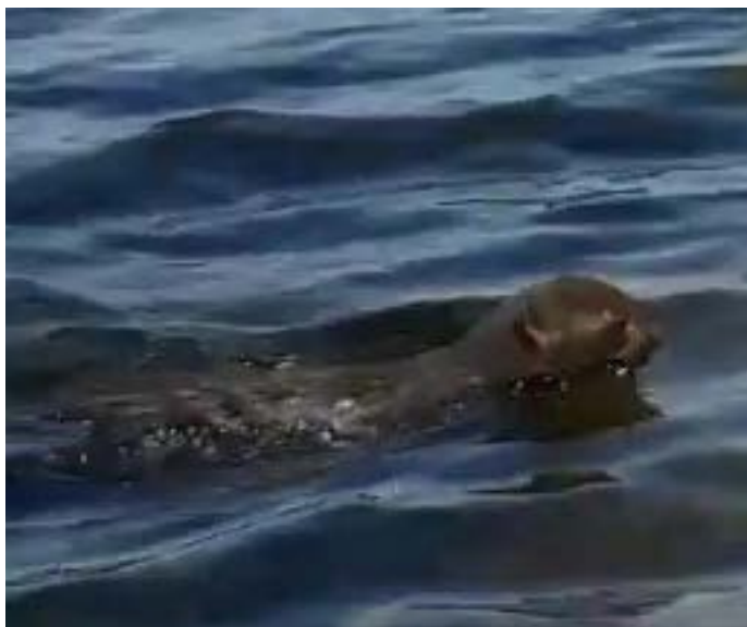
Figura 2. Individuo de Herpailurus yagouaroundi observado en Bahía la Graciosa, Refugio de Vida Silvestre Punta de Manabique, Puerto Barrios, Izabal, Guatemala. Créditos del video: Sergio Hernández (Analista Marino costero RVSPM).

Esta nota es una contribución importante al conocimiento del poco estudiado félido neotropical Herpailurus yagouaroundi y a su comportamiento. Nuestra observación permite que se generen preguntas como ¿qué tan común es este comportamiento? ¿este evento se relaciona con uso de peces u otro recurso acuático? ¿podría ser respuesta a alguna perturbación del hábitat? A pesar de ser un área importante por la interconectividad con otras áreas protegidas de Izabal, Guatemala (Reserva Protectora de Manantiales Cerro San Gil, Parque Nacional Río Dulce, Reserva de Usos Múltiples Río Sarstún), el Refugio de Vida Silvestre Punta de Manabique es un área particularmente vulnerable por su alta tasa de deforestación, el manejo inadecuado de la Cuenca del Río Motagua y la extracción de fauna (FUN-DARY et al. 2006; IARNA-URL 2012; CONAP 2013).