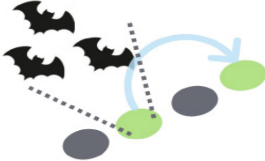
Representación de la forma de avance, los murciélagos viajeros seleccionan parches de hábitat óptimo (verde) y recorren su ruta efectuando pequeños vuelos de parche en parche. Autor: Gabriel Gutiérrez-Granados.

vuelo, se desconocen exactamente las consideraciones que realizan, pero a partir del estudio de las migraciones de aves, donde se ha documentado que tienen rutas específicas por las que van encontrando áreas de reposo, se ha hipotetizado que los murciélagos viajeros podrían tener en cuenta al menos la seguridad de la ruta y el tiempo que durará el viaje.