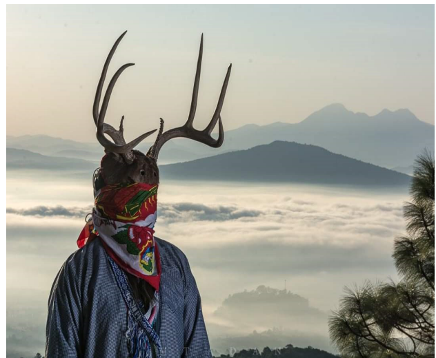
Cosmovisión entre la dualidad: día-noche, venado-jaguar, axuni-puke , fuego-agua, Curicaveri-Xaratani , aire-trueno, fertilidad-alimento, niño-adulto. El árbol de la vida.

De acuerdo con David Linares, la danza de los pukes , es una reconstrucción de las comunidades originarias de la zona de la ciénega y lacustres de Pátzcuaro, representado por el venado que aún se ve caminar y saltar por los bosques P'urhepechas. En cada una de las cuatro localidades, los habitantes se preparan para el momento de la fiesta, donde se baila al compa de la música, y son interpretados los movimientos dancísticos, acompañados de música de banda de viento. La característica central de un danzante puke , es a la vez venado y felino (dualidad), mismo que queda representado al momento de realizar la danza. Donde transmuta de un ser a otro, conforme pasa el día y la noche, donde la tradicional máscara está conformada por las astas de los venados, la cara o cabeza que va forrada por piel del mismo, o bien, suplida por la de un borrego, y por su parte frontal, a la cual se le agregan crines de caballo figurando una barba, máscara que es ajustada y apretada en la cabeza del danzante por un paliacate.