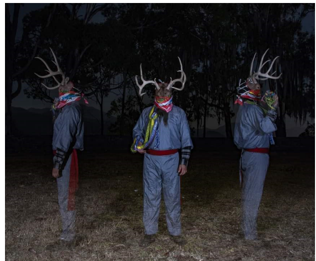
El venado cola blanca, la danza de los pukes en la cosmovisión de los P'urhepechas en Michoacán.

Dentro de la cosmovisión P'urhepecha, el puke es un ser mítico, un animal mitológico con cualidades, características, esencia, e identidad propia. Lo que le permite transmutar en un mismo baile y danza. Durante el día, agilidad, rapidez, saltos, los cuales van disminuyendo hacia la tarde, para convertirse en felino acompañado de la obscuridad, desplegando movimientos lentos, sigilosos, medidos, característicos de los felinos. Los pukes tienen presencia viva en Michoacán y son representados en las diferentes iconografías de los bordados de fajas, cintas y tejidos. Donde se afirma que es un felino, o un animal que posiblemente se perdió en el tiempo, pero aún se pone de manifiesto en los elementos ambientales y socio-culturales de la entidad.