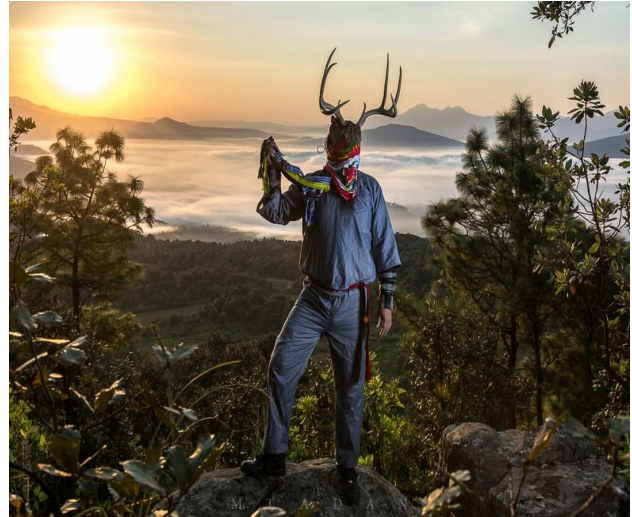
Danzante Puke . Al fondo se aprecia la neblina sobre el lago de Pátzcuaro al amanecer, el cual da paso al despertar del venado ( axuni ) en la porción serrana en la meseta P'urhepecha en Michoacán.

en sus agilidades, fortalezas, destrezas, movimientos lentos y sigilosos, movimientos nocturnos y crepusculares, matutinos y vespertinos. Entre los pueblos originarios de México, es común las representaciones de divinidades en dualidad, a manera de representar: lo masculino, lo femenino; el calor, el frío; la vida, la muerte; la tierra, el agua; el día, la noche; la fuerza, la debilidad; y complementar los lados opuesto, tal es el caso del venado y el felino dentro de la cosmovisión P'urhepecha.