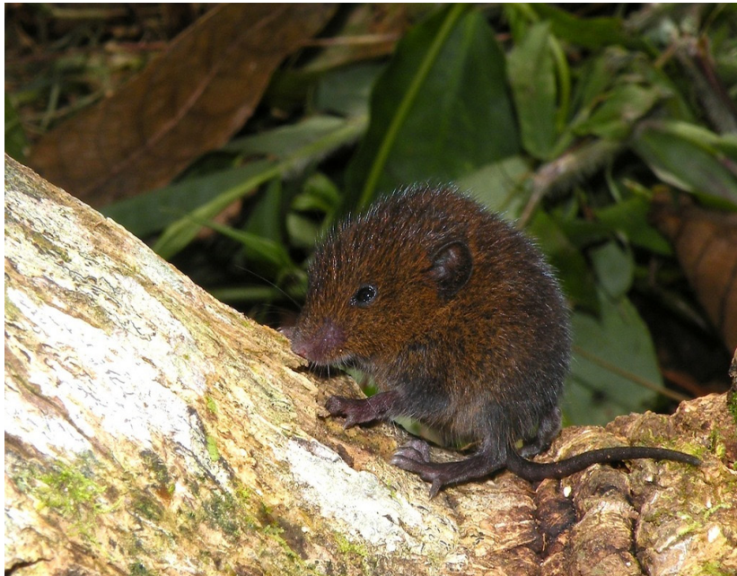
Ratón cantor de cola corta ( Scotinomys teguina ).